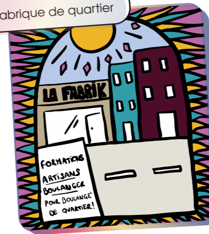
La Fabrique de quartier

Un pôle alimentaire qui coopère avec les commerçant.es locaux et les nouveaux lieux de formation (Tiers-Lieux) pour appuyer la création d'activités « nourricières » utiles au quartier.