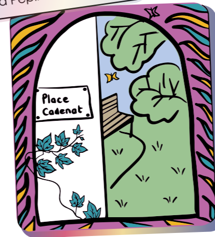
La Pépinière de quartier

Les énergies et les idées des associations locales / collectifs citoyens , alliées à des savoir-faire techniques (Espaces Verts de la Ville, écologues, etc.) ont permis de transformer la place Cadenat en pépinière de quartier.