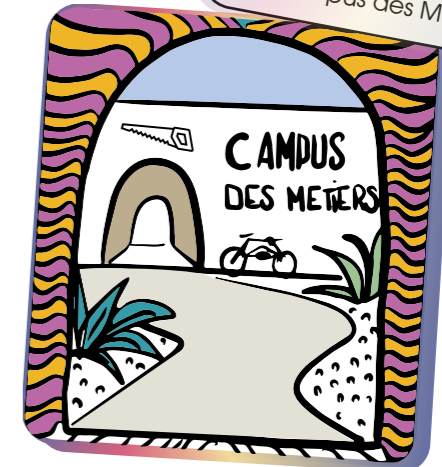
Le Campus des Métiers

Un lieu de renouvellement des pratiques d'apprentissages , tourné vers l'artisanat et les "nouveaux métiers de la transition".